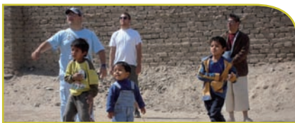
◀ Village « Enfants des Andes », Pérou - Août 2010

En participant à un tel séjour, nous vous assurons de vivre une expérience humaine unique et inoubliable !