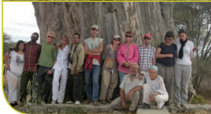
◀ Tanzanie - Août 2012