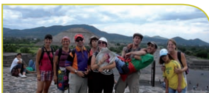
◀ Teotihuacan, Mexique - Août 2011