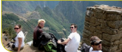
◀ Machu Picchu, Pérou - Août 2010